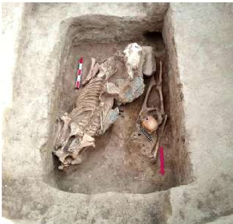
Рисунок 4. Северная группа курганов могильника Актерек, курган № 6

Второй курган № 6 северной группы могильника Актерек располагался на плато Такия тобе, был раскопан Археологической экспедицией ЦГМ РК в 1917 г. (Айтқұл, Мьякшова, Торежанова и др., 2018, с. 137-142).