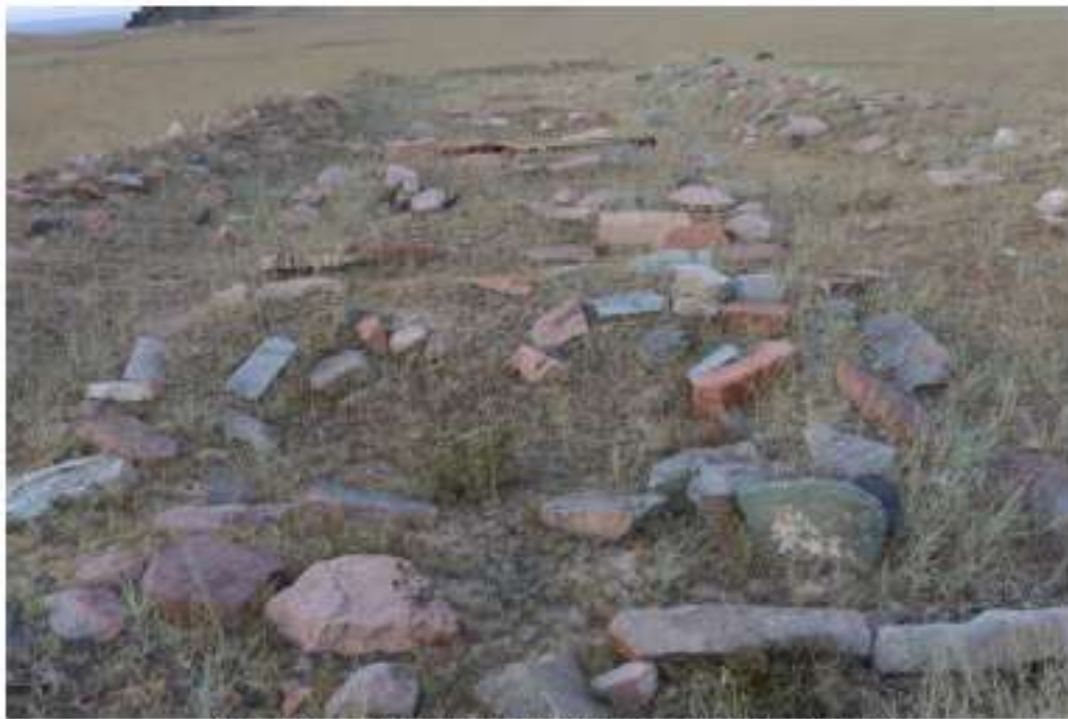
Рисунок 2. Каменные оградки после раскопок. 2022 г.

Подобные памятники найдены в большом количестве на территории Алтая, Казахстана и в разных районах Тувы.