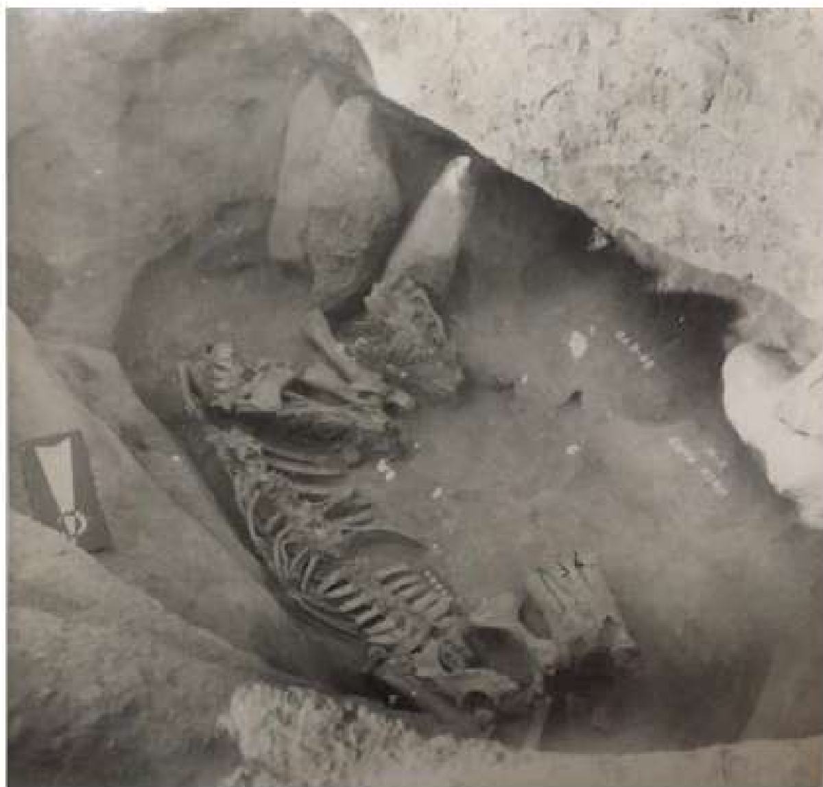
Рисунок 3. Захоронение с конем. Раскопки САЭ 1986 г.

На плато Таян тобе в урочище Актерек, раскопано несколько захоронений с конем тюркского времени. Один был раскопан САЭ в 1986 г. Объект располагался на северном склоне небольшого холма, в северной части могильника. Курган имел овальную однослойную каменную выкладку. В центре выкладки выступали камни верхнего слоя – забутовка могильной ямы. На глубине 1 м в южной стороне ямы выявились крупные камни, оказавшиеся заставкой подбоя. На дне входного помещения открылось захоронение коня. Конь положен на брюхо, ориентирован головой на юг. В подбое сохранились разрозненные кости человека, человек был погребен в вытянутом положении на спине, головой на север-северо-запад. Погребальный инвентарь представлен сильно коррозированными фрагментами удили и наконечником стрелы.